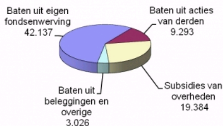
Baten 2009 (in duizenden euro's)

De samenstelling van de baten over 2009 is als volgt: